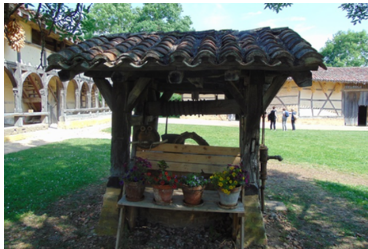
Visite de la ferme des Planons