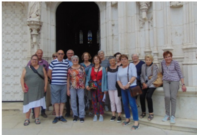
Les " Sans souci" à l'église de Brou à Bourg en Bresse